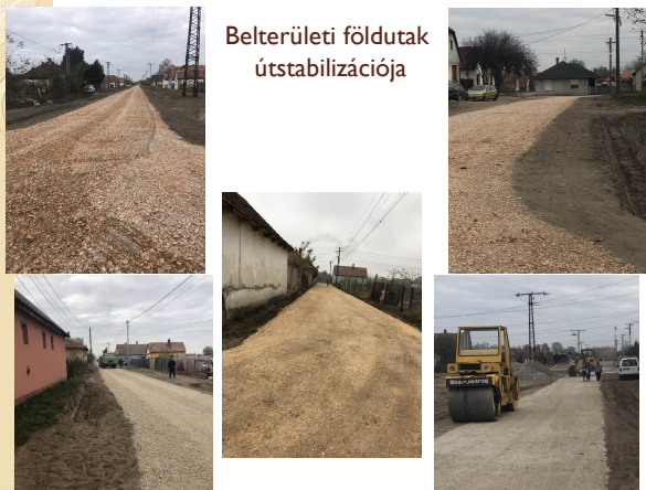
Belterületi földutak útstabilizációja