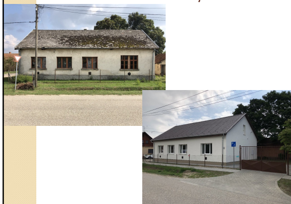
Cédula ház felújítása