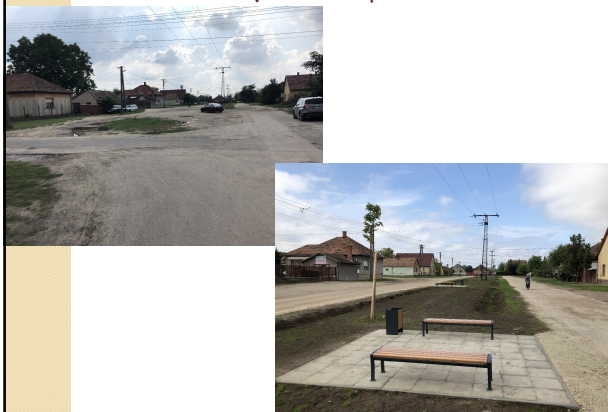
Damjanich utcai parkosítás